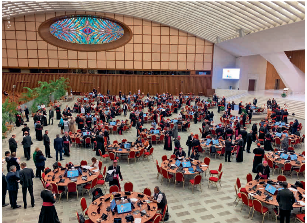
Eine ganz neue Form des Austauschs an der Weltsynode in Rom.

Kapitel 9 widmete sich explizit den Frauen. Die Vorsicht und das Ringen um jedes Wort sind hier deutlich zu spüren. Ein Scheitern der Abstimmung an diesem umkämpften Thema sollte auf jeden Fall vermieden werden. Worauf man sich einigen konnte: «Die Kirchen in aller Welt haben den Ruf nach einer stärkeren Anerkennung und Aufwertung des Beitrags der Frauen klar formuliert.» Es